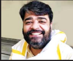
करेगी। उन्होंने कहा कि यह जीत मोदी व खट्टर की चहुंमुखी विकास पर भी बरौदा की जनता मोहर लगाएगी। असीम गोयल ने कहा हरियाणा में 6 साल में मनोहर लाल

को अपनी चौधर से जोड़कर लड़ रही है। असीम गोयल ने कहा कि वह जमीनी स्तर पर बरौदा में काम करके आए हैं। गांव गांव घूमकर वोटों से मिले और असीम गोयल ने कहा कि उनका दावा है कि पहलवान योगेश्वर दत्त की जीत अंगद के पांव जैसी होगी। और उन्होंने कहा कि योगेश्वर की जीत किसी व्यक्ति विशेष की चौधर की जीत नहीं बल्कि यह जीत बरौदा की छतीस बिरादरी की जीत होगी, यह जीत पूरे विश्व में बरौदा का नाम