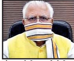
करेगा उससे फिर सख्ती से निपटा जाएगा। इसके साथ सीएम खट्टर ने

चेतावनी दी है। हरियाणा दिवस के मौके पर करनाल में आयोजित खेल दिवस कार्यक्रम में पहुंचे सीएम खट्टर ने कहा कि सभी को अपनी बात रखने का अधिकार है, लेकिन कानून व्यवस्था किसानों को अपने हाथ में नहीं लेना चाहिए। उन्होंने कहा कि किसान शांति पूर्वक अपना प्रदर्शन करें, अगर कोई भी कानून व्यवस्था बिगाड़ने की कोशिश