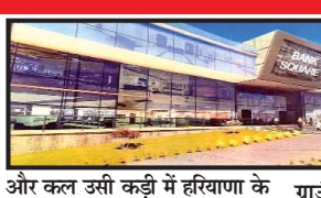
और कल उसी कड़ी में हरियाणा के

अम्बाला (ज्योतिकण न्यूज़) : हरियाणा के गृह मंत्री अनिल विज ने शायद टान रखी है कि अपने छावनी विधानसभा क्षेत्र को देश का सबसे महत्वपूर्ण क्षेत्र बनाना है यही कारण है कि पिछले 6 साल से करोड़ों रुपए के विकास के कार्य निरंतर चल रहे हैं।